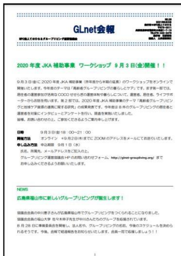
GLnet NO. 26