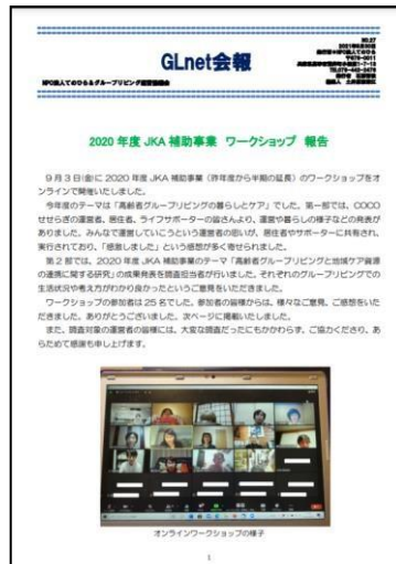
GLnet NO. 27