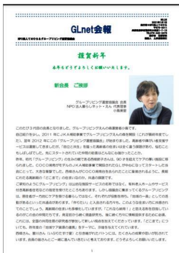
GLnet NO. 25